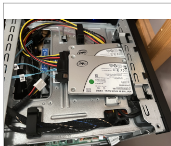
Instalados a las bravas

puede incrementar su capacidad a 8 HDDs o 9 si contamos el conector sata del lector de CDs (La capacidad de 9 es una teoría mía sin confirmar). Como no, por temas de espacio, estos discos duros o SSDs adicionales tendrían que ser de 2.5". Para montar estos discos en el Microserver Gen8 hay varias aproximaciones: