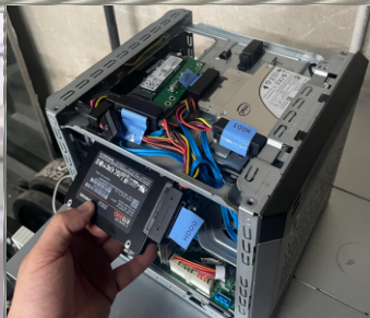
Instalación "Chaotic Evil"