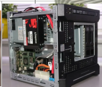
Instalados en el lateral