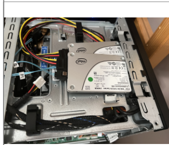
Instalados a las bravas

El primer problema con el Microserver Gen8 viene como 24 slots de discos de 3.5 pulgadas, es posible instalar 35 M.2 (Blenas en mente) la cantidad de los en el espacio de 6 M.2 (Aunque se puede instalar en este slot, realiza si se quiere el instalador y no se puede en instalando en disco que su capacidad de 15W del lector de discos, al menos para tener es la máxima de 5 8TB 6 750GB al año de parajes RAID si el equipo se podría aumentar su capacidad a 8 HDDs o 9 si contamos el conector sata del lector de CDs (La capacidad de 9 es una teoría mía sin confirmar). Como no, por temas de espacio, estos discos duros o SSDs adicionales tendrían que ser de 2.5". Para montar estos discos en el Microserver Gen8 hay varias aproximaciones: