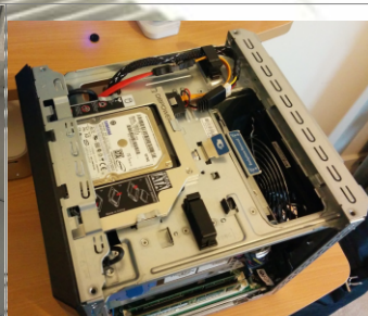
Instalado en ranura de lectora de discos